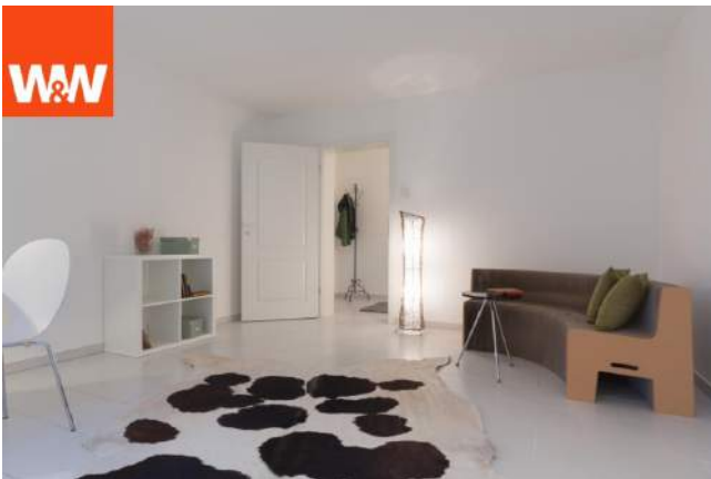
Arbeits- oder Kinderzimmer