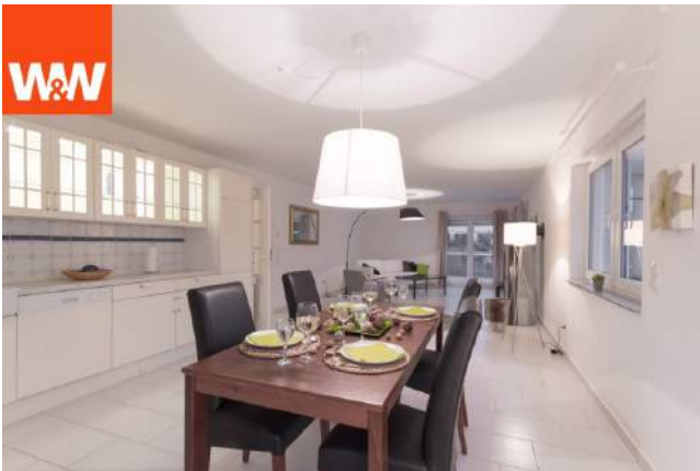
riesiges Wohn- u. Esszimmer