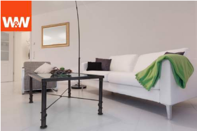
alles topp gepflegt!