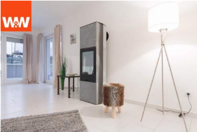
Wohnzimmer mit Kamin