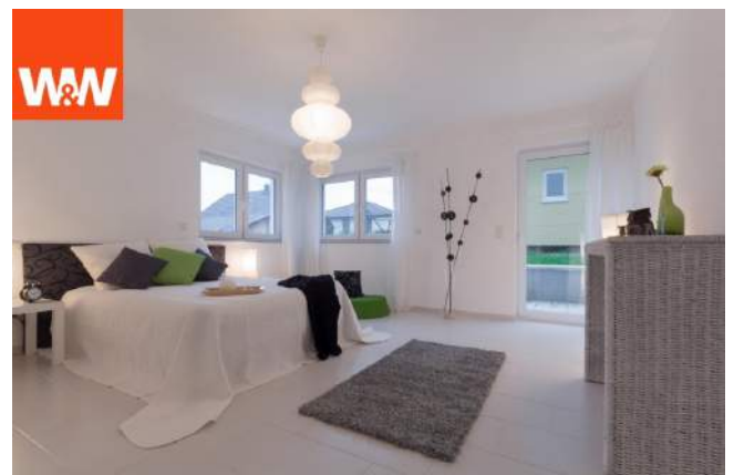
hell und lichtdurchflutet in allen Räumen