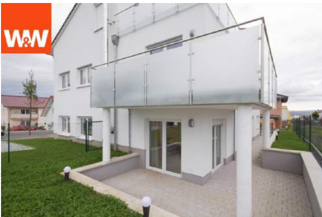
Rückansicht mit Terrasse