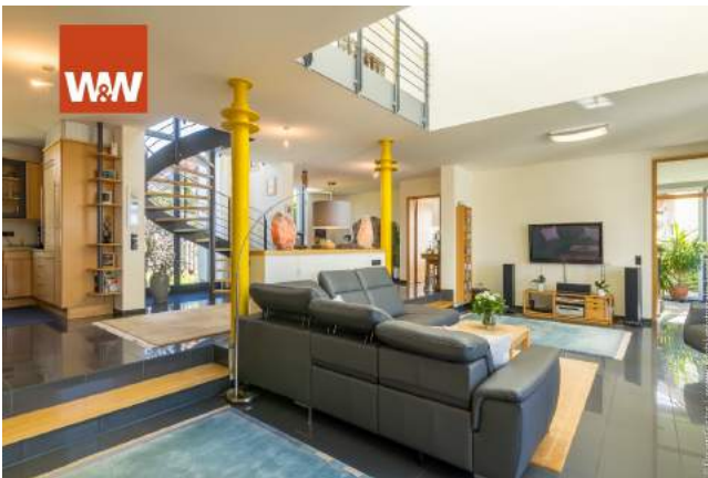
...mit Blick auf die Galerie