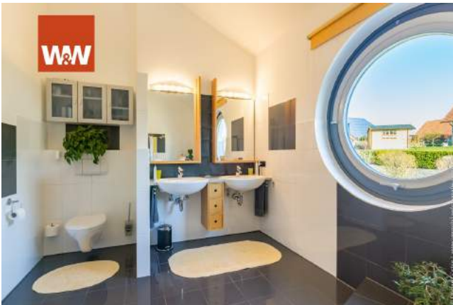
..im 1. Obergeschoss