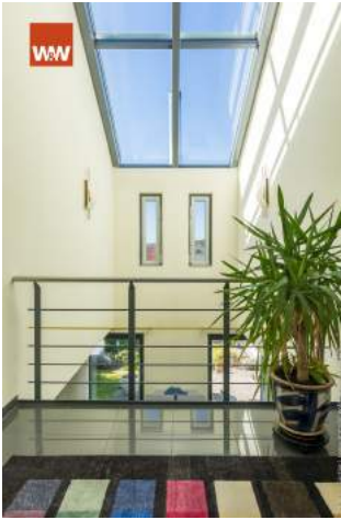
Galerie mit Lichteinlass