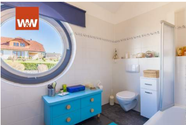
Bad Nr. 2